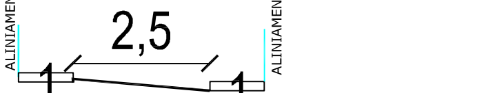
PROFIL TRANSVERSAL STRADA VERONICA MICLE (SENS UNIC)